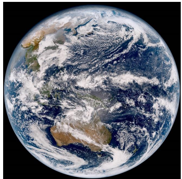
日本の気象衛星「ひまわり」から見た地球

たとえば、日本の天気予報のために雲の様子や大気の状態を観測する気象衛星は、日本の上空の雲を24時間みはることができる軌道にあると便利ですね。このような軌道にある衛星は地球から見ると空の1点に止まっているように見えるため、このような軌道を「静止軌道」と呼んでいます。