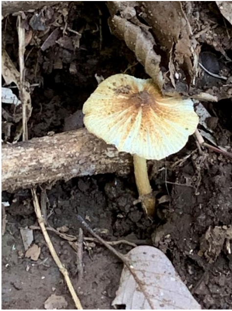
アセタケのなかま