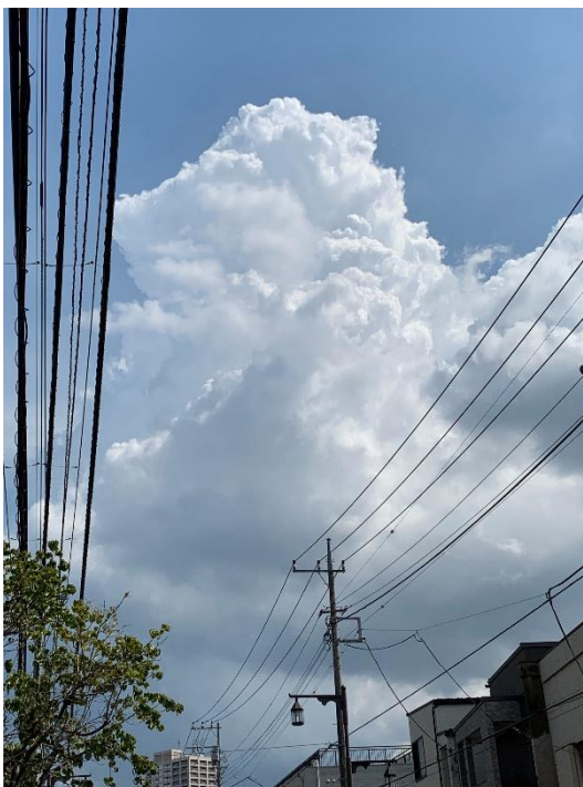
帰りに見えた積乱雲

スマホで撮っているのですが、やや画像が粗いものがありますが、こんな感じで 充実した1日でした。長そでで歩いたので日焼けは顔だけでしたが、汗だくで 歩いたので、夜はちょっと体がほてって寝苦しかったです。