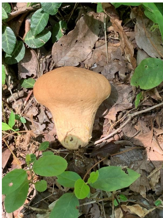
ノウタケのなかま