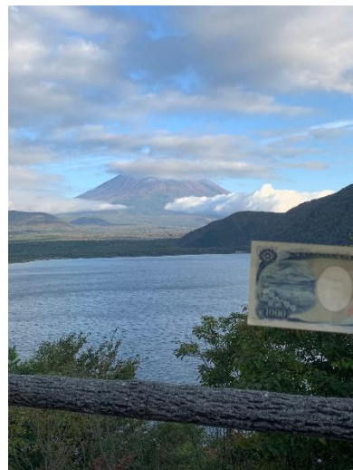
もとすこほん み み ふ ふ じ じ ざん ざん 本 もと 栖 す 湖 こ 畔 ほん から み 見 み た ふ 富 ふ 士 じ 山 ざん 、右 みぎ は き 旧 き 千 せん 円 えん 札 きつ の うら 裏 ら 面 めん と の ひ ひ か か く 比 ひ 較 かく