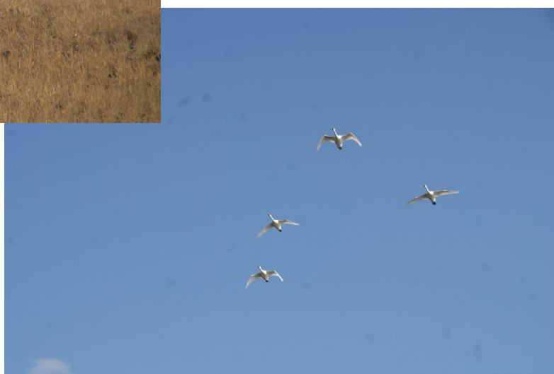
ハクチョウの編隊飛行。レンズの汚れが……