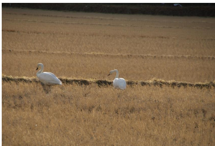
田んぼでえさをとるハクチョウ