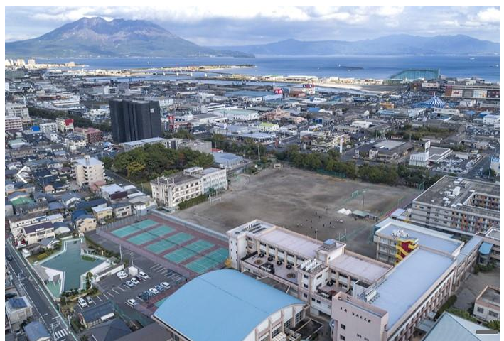
あん Do の母校 左奥に見えるのは桜島